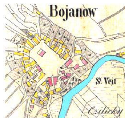
Bojanov – středisko újezdu, založené před r. 1329 s prvky městečka, mapa z r. 1839

Význačným jevem v utváření sídel ve vrcholném středověku představuje zakládání tržních, správních i církevních středisek formou městeček. Nejstarší zmínka o sídle jménem Bojanov pochází z roku 1329, tehdy českému království vládl Jan Lucemburský. Poprvé se o Bojanově jako městečku píše v listině datované do roku 1564 (tj. za panování prvních Habsburků). K domněnce, že byl Bojanov založen ve vrcholném středověku, vede historiky řešení jeho středu - tj. gotickým způsobem s pravidelnou plochou náměstí. Kostel bývá v dané zástavbě situován při rohu náměstí.